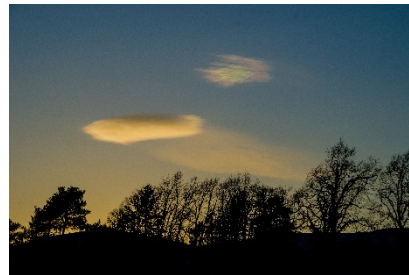
Wolke, Fort Augustus