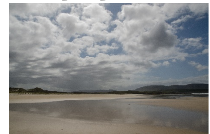
Wolken, bei Ardara