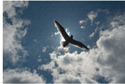
Möwe, Firth of Clyde