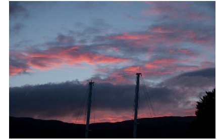
Abendhimmel, Fort Augustus