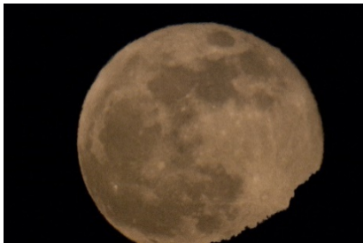
Blue Moon, Tucson