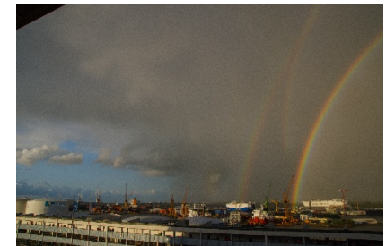
4-fach Regenbogen, Bremerhaven