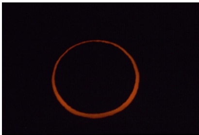
Ringförmige Sonnenfinsternis, Stornoway