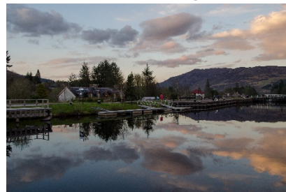
Wolkenspiegelung, Fort Augustus