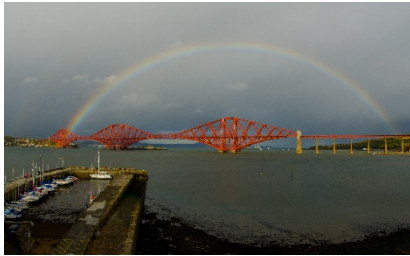
Regenbogen, Firth of Forth